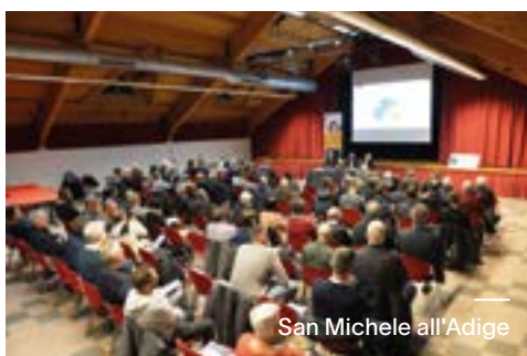
San Michele all'Adige