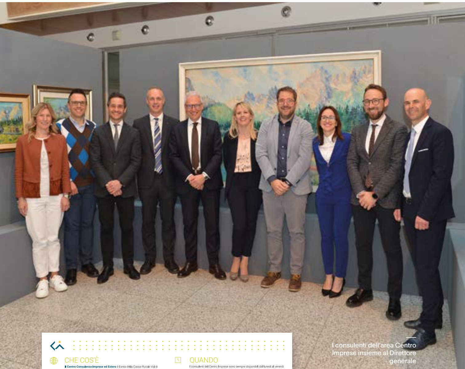
I consulenti dell'area Centro Imprese insieme al Direttore generale