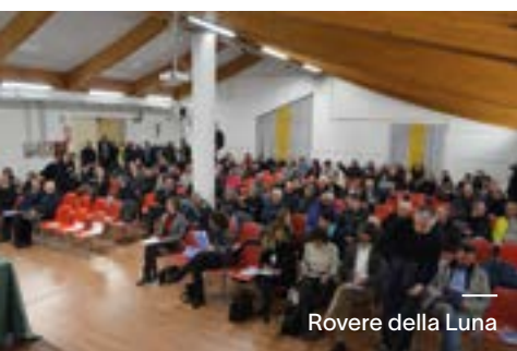
Roverè della Luna

al Libro Soci, segno tangibile di vicinanza a chi ha contribuito nei decenni alla crescita del credito cooperativo locale. Gli incontri si sono tenuti a Roverè della Luna, Tres, San Michele all'Adige, Tassullo e Livo.