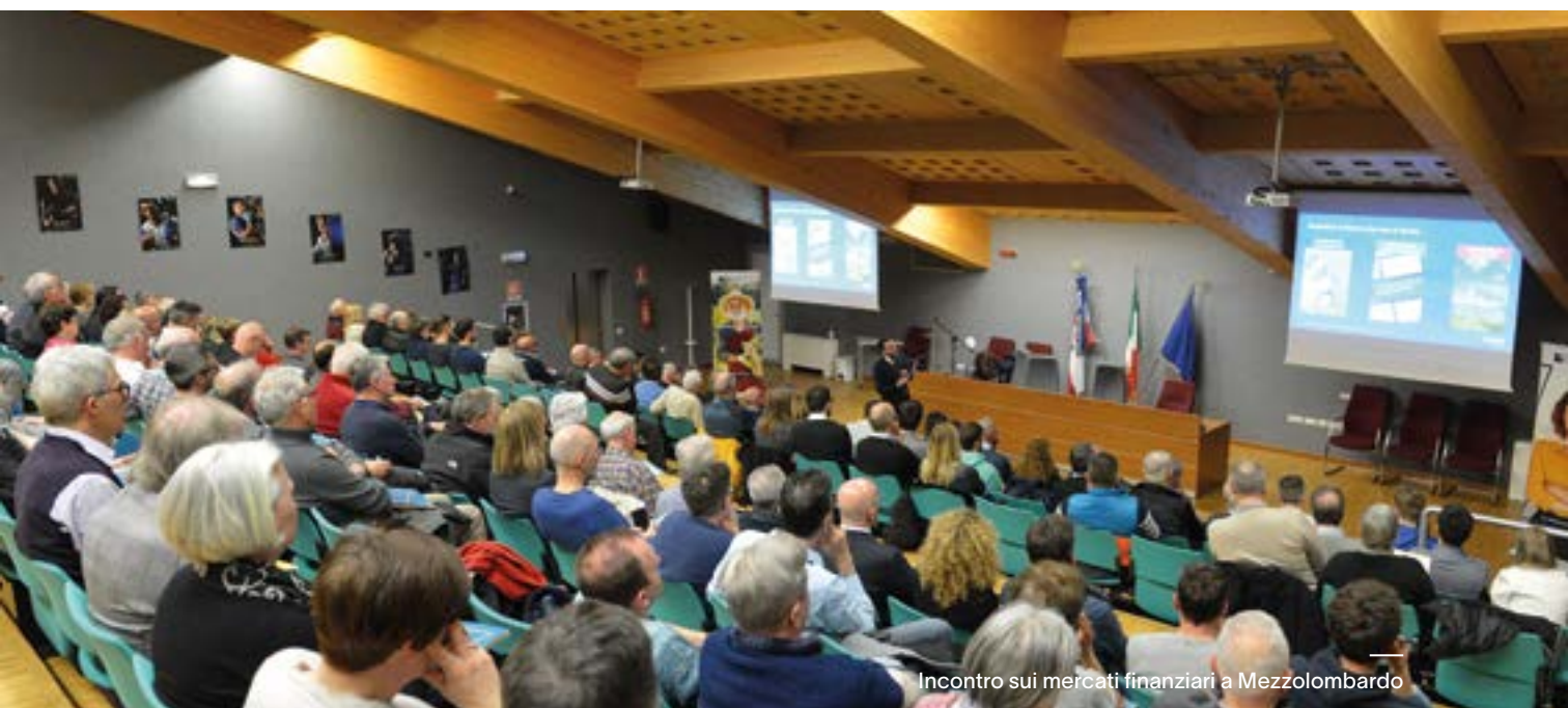
Incontro sui mercati finanziari a Mezzolombardo

vato protagonismo delle banche centrali. Stiamo probabilmente assistendo alla nascita di un nuovo paradigma economico a livello globale, che rende le scelte di investimento sempre più complesse, anche per le implicazioni emotive che spesso le governano.